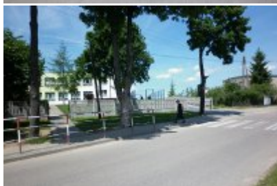
▪ 2 - Jabłonka Kościelna