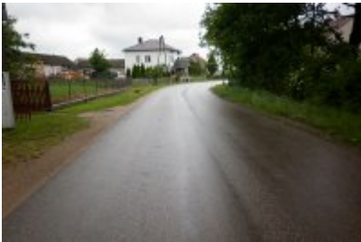
▪ 10 - Kruszewo Wypychy