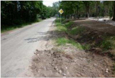
▪ 8,9 - Ciechanowiec