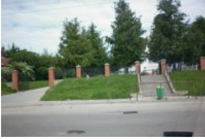
▪ 7 - Rosochate Kościelne