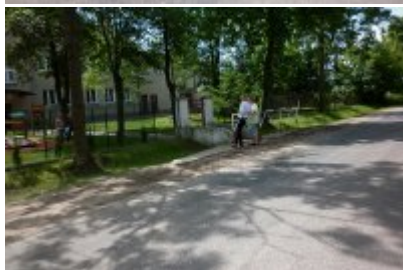
▪ 1 - Wyszonki Kościelne