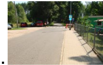
■ 10 - Gościm