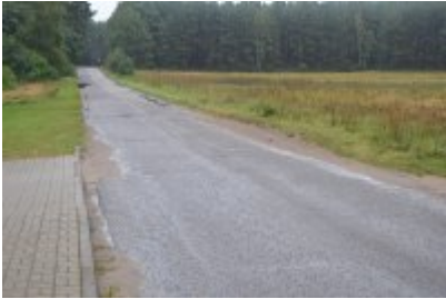
6,7 - Lubiátów