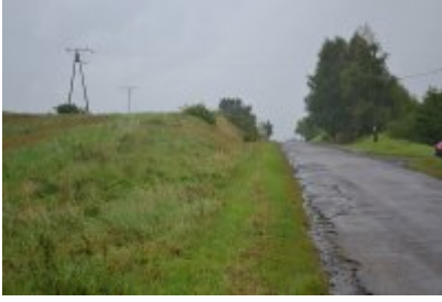
■ 9 - Osiek