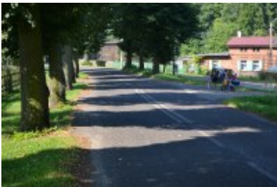
8 - Grąsy